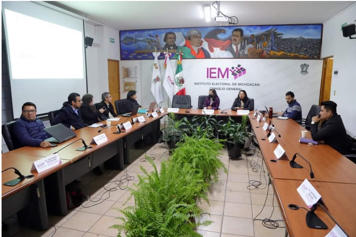
Reunión de Trabajo Formal de la Comisión del PREP, del 14 de diciembre de 2023